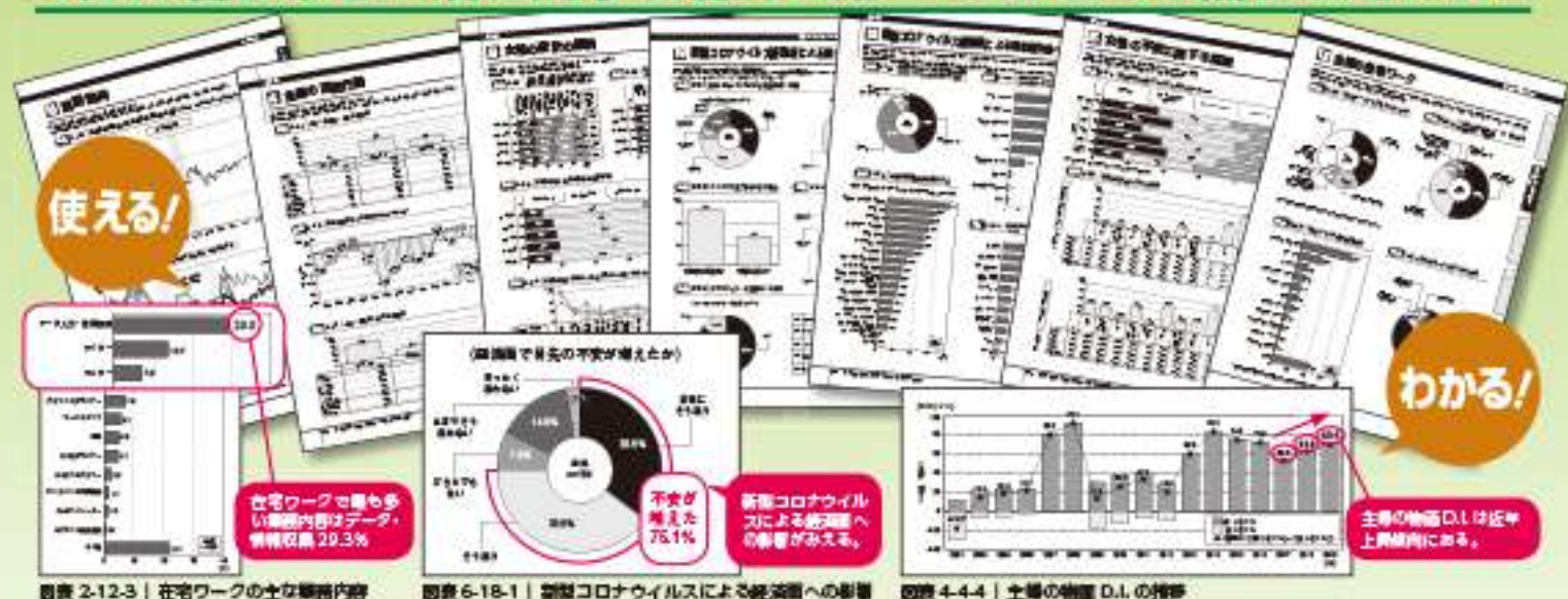
図表 2-12-3 | 在宅ワークの主な業務内容

例えばこんなことがわかる・図表グラフが900点以上掲載 女性の暮らしと生活に関する様々なデータがこの1冊にまとまった